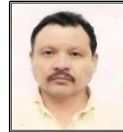
Jefe de la Oficina Operadora

La dirección de la Oficina Operadora es avenida Ávila Camacho esquina Nicolás Bravo número 207, colonia Centro, C.P. 93600, Martínez de la Torre, Ver., y cuenta con el sitio web http://187.174.252.244/caev/Oficinas_Operadoras/MartinezdelaTorre/ .